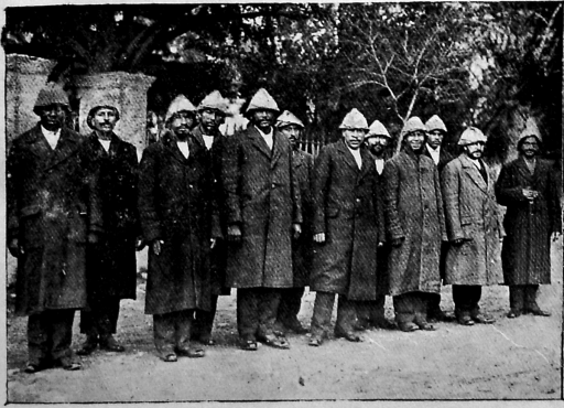
آلمانیا اردولری طرفندن فرانسه ساحه حربنده اسیر ایدیلرک برجه ایله اولتی اوزره دارالخلافه ایعزام اولونان دینداش لر یزدن اخیراً درساعده وامسات ایدن ایلیک قافله Les musulmans des colonies francaises faits prisonniers par l'armée allemande et arrivés à Constantinople.

بوسوره ده مضمونک موعظه کتیر مساجد جها و مساجد شریفه توزیع ایچون قرائت اولونورق . موعظه کتیر مساجد جها و مساجد شریفه توزیع ایچون قرائت اولونورق . موعظه کتیر مساجد جها و مساجد شریفه توزیع ایچون قرائت اولونورق . موعظه کتیر مساجد جها و مساجد شریفه توزیع ایچون قرائت اولونورق .